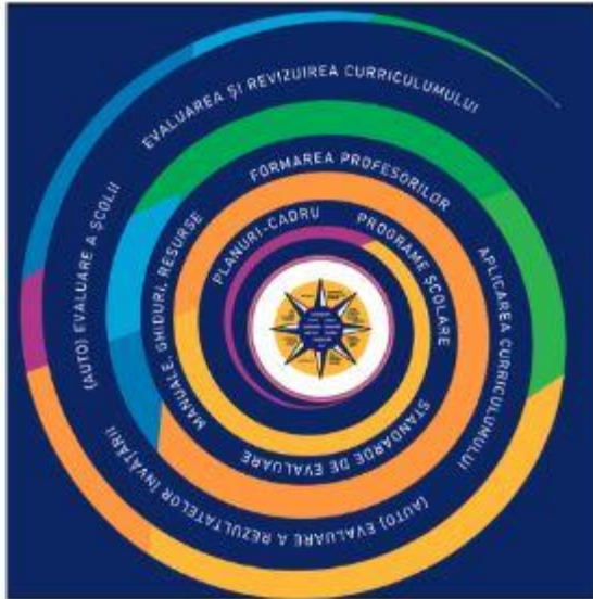
Figura 2. Continuumul predare-învățare-evaluare

În acest sens, profilul de formare al absolventului funcționează ca nucleu ce fundamentează, influențează și orientează constructul curricular, din perspectiva imediată a documentelor reglatoare, planuri-cadru de învățământ și programe școlare, precum și din perspectiva aplicării curriculumului: