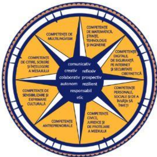
Figura 1. Dimensiuni principale care contribuie la definirea profilului de formare al absolventului

Profilul de formare al absolventului funcționează ca o busolă pentru întregul sistem educațional, în care elementele continuumului predare-învățare-evaluare conlucrează pentru realizarea idealului educațional definit în lege.